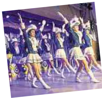
In Höhr-Grenzhäuser wird die närrische Jahreszeit in vollem Gange.