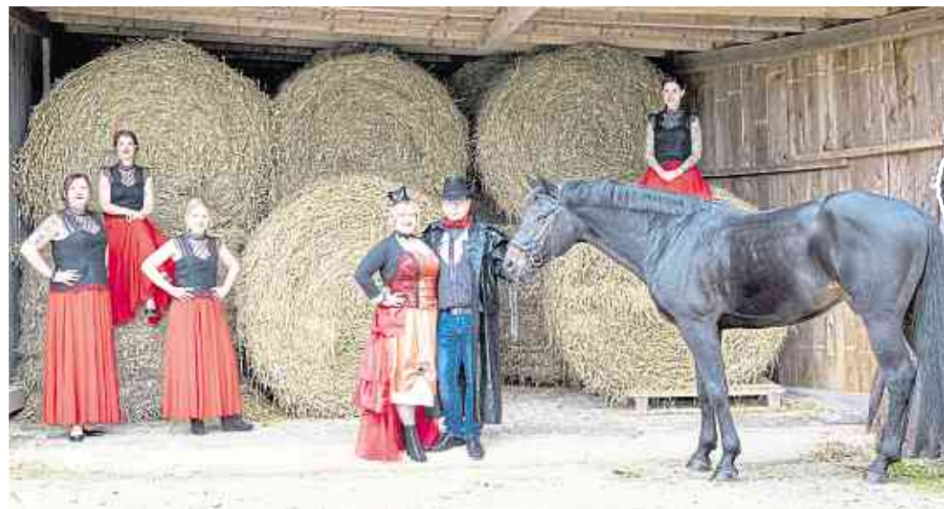
Alle Mädels der „Young Generation“ sind Vollblut-Möhnen.