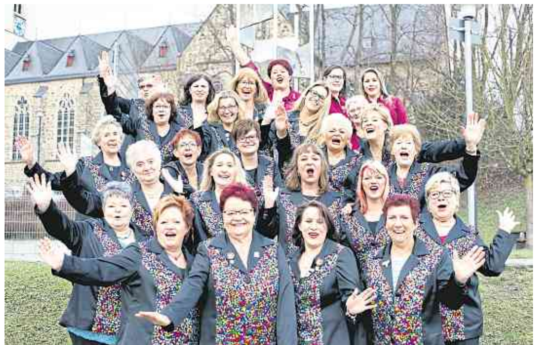
Die Möhnen aus Höhr sind fest ins kulturelle Leben eingebunden.