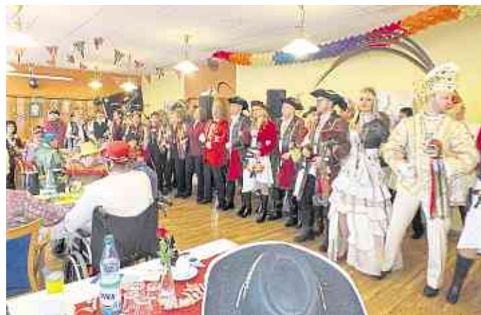
Das Prinzenpaar 2017 war bei seinem Besuch im AWO Seniorenzentrum unter dem Motto „Auf Kaperfahrt durch Höhr-Grenzhäuser“ unterwegs.

Die Bewohner des AWO Seniorenzentrums freuen sich jedes Jahr auf das Höhr-Grenzhäuser Prinzenpaar, dass es sich natürlich nicht nehmen lässt, mit samt seinem Gefolge der Karnevalsfeier einen närrischen Besuch abzustatten.