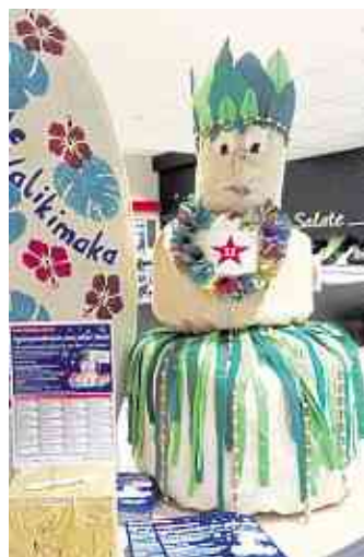
Kath. KiGa St. Martin