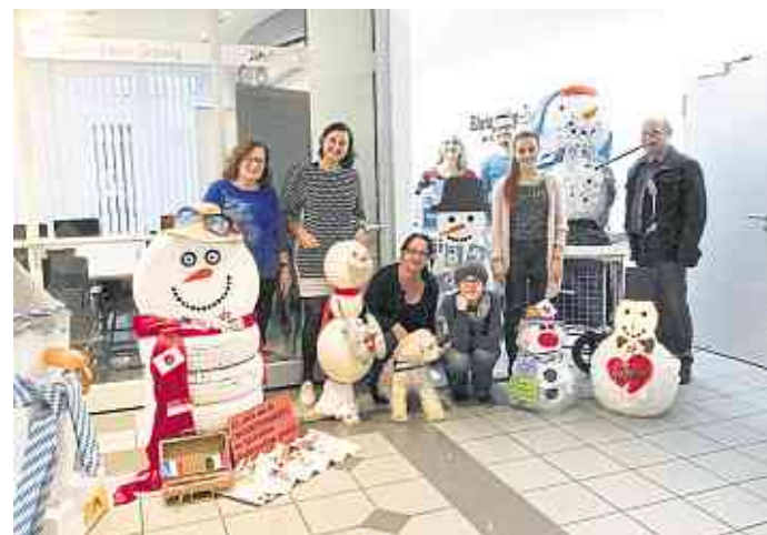
2017 erreichten auch einige Schneemänner das Team der rz-Media in Bad Ems.