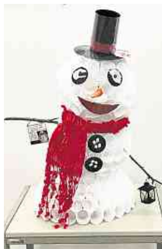
Kita Eisenbach: Höhlengruppe