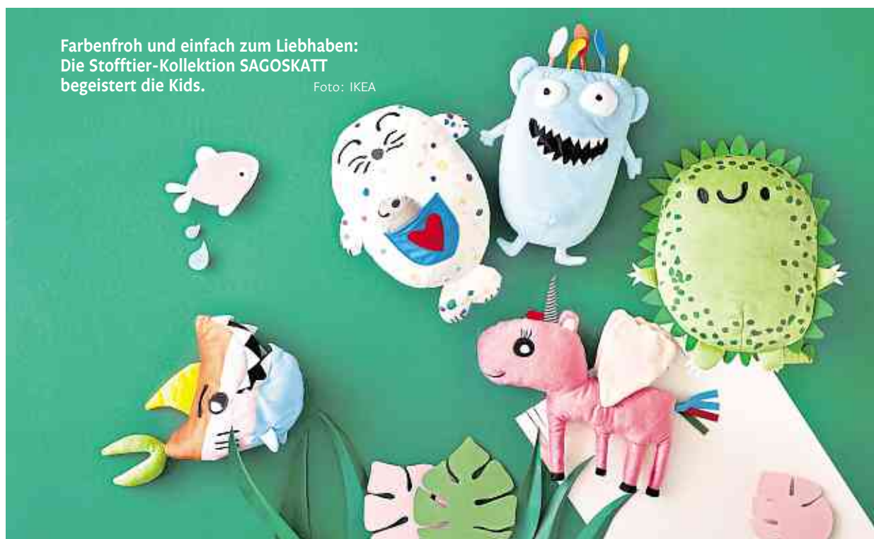
Farbenfroh und einfach zum Liebhaben: Die Stofftier-Kollektion SAGOSKATT begeistert die Kids.

betreut. Musikalische Angebote über den üblichen Rahmen hinaus sind fest in der pädagogischen Arbeit verankert, sodass die Kinder ihre Talente ausleben, Erfolgserlebnisse sammeln und ein starkes Gemeinschaftsgefühl erleben können. Mitte des Jahres unterstützte IKEA Koblenz mit 8000 Euro die 15. Benefiztour des Radteams von nestwärme, dem Verein zu-