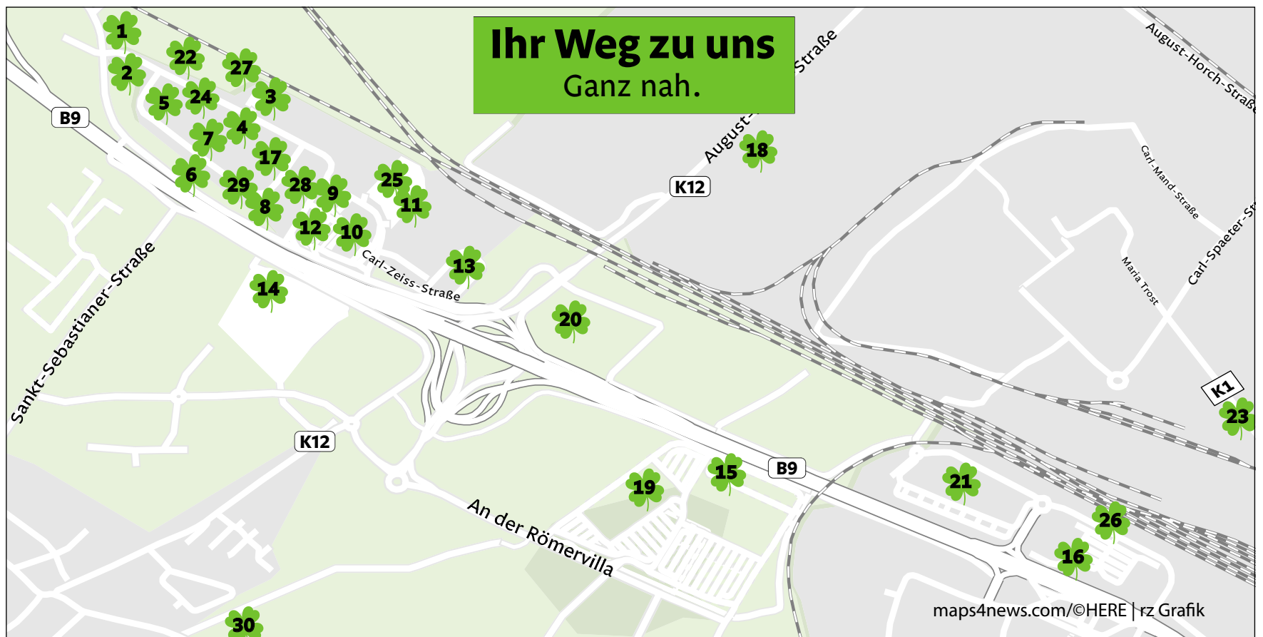
maps4news.com/©HERE | rz Grafik

Vielfalt, Qualität, Kundennähe. Drei Merkmale prägen den Gewerbepark. Gemeinsame Aktionen und Veranstaltungen werden rechtzeitig bekannt gemacht. Die Kunden dürfen sich auf ein Angebot freuen, das ihre Erwartungen erfüllt und vermutlich übertrifft. Überraschendes entdecken, Neues finden, Bewährtes aufgreifen: Der Gewerbepark Koblenz ist Teil einer großen Stadt; er liegt inmitten einer einzigartigen Region; er vereint viele Vorteile, von denen Kunden profitieren. Axel Holz