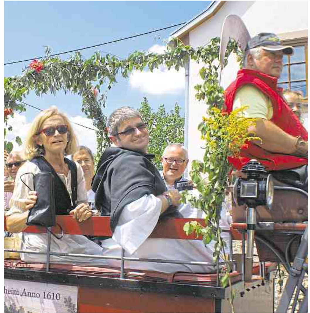
Wundervolle Umgebung, bester Wein, schönstes Wetter: Das sind die Zutaten für ein gelungenes Weinfest. Die Gemeinde Hackenheim hofft auf Petrus' Segen, für den Rest ist ganz sicher gesorgt!

Bürgermeister der Verbandsgemeinde Bad Kreuznach