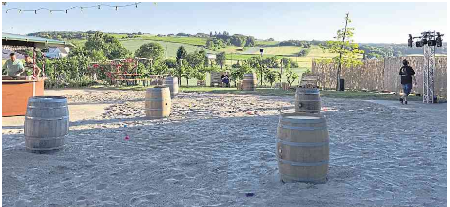
Urlaubsfeeling in Frei-Laubersheim – Wine on the beach macht es möglich.