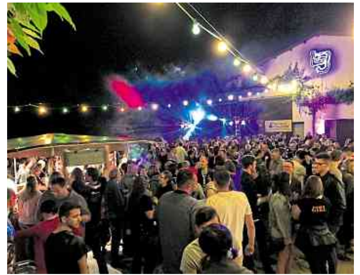
Rund 600 Besucher werden wohl auch dieses Jahr wieder zur Strandparty im Weingut strömen.