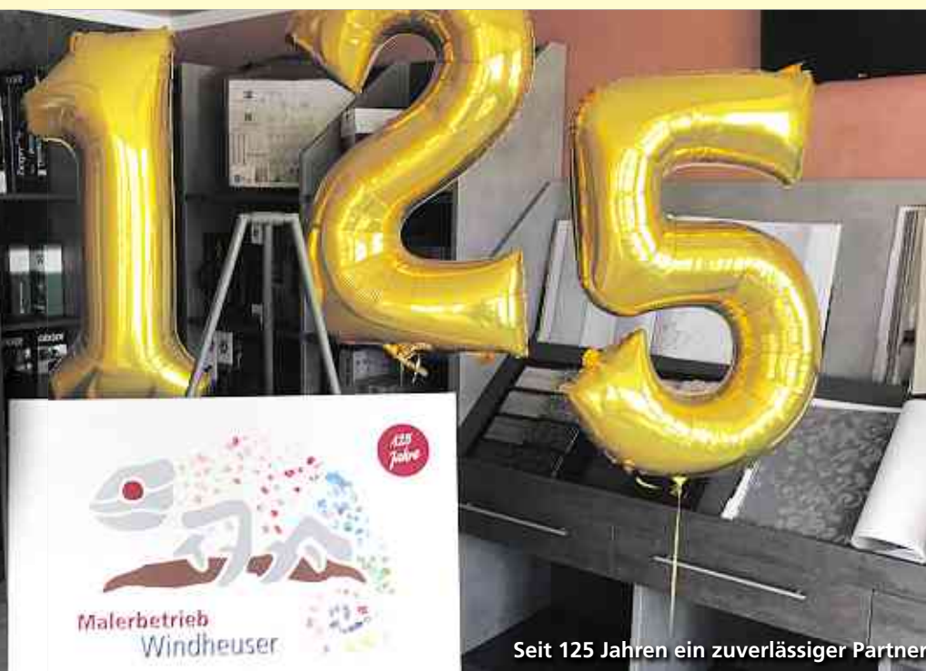
Seit 125 Jahren ein zuverlässiger Partner

Gemeinsame Ziele, Leitbilder und Werte sowie die persönlichen Qualitäten des Einzelnen haben uns zu dem gemacht, was wir heute für Sie sind und auch in Zukunft bleiben wollen.