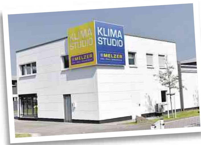
KLIMA STUDIO KOBLENZ

Wir stärken auch unseren Azubis zum Mechatroniker für Kältetechnik den Rücken. Denn wir garantieren ihnen nicht nur eine fundierte Ausbildung, wir machen sie zusätzlich mit Lehrgängen sowie in unserer eigenen Lehrwerkstatt fit für eine erfolgreiche Karriere.