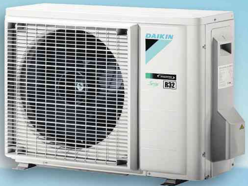
DAIKIN Außeneinheit ARXP 20 L