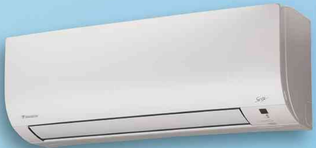
DAIKIN Wandmodell AXP 20 L