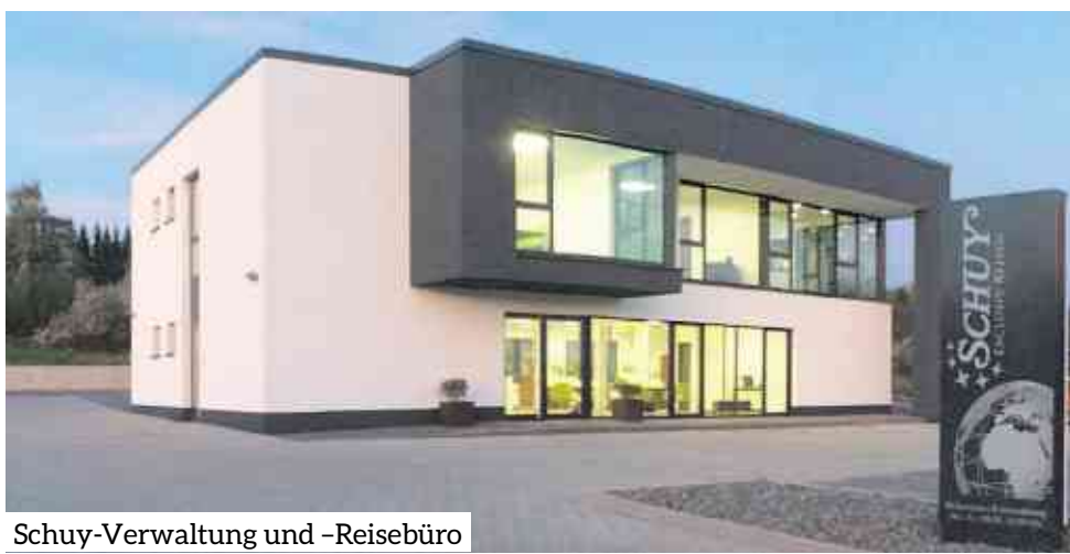
Schuy-Verwaltung und -Reisebüro