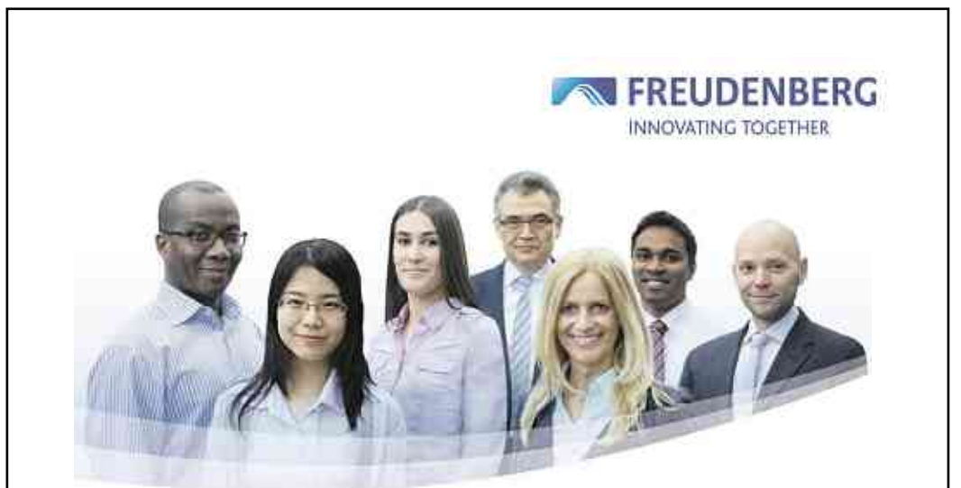
FREUDENBERG INNOVATING TOGETHER

Die Freudenberg Gruppe, ein globales Technologieunternehmen mit 40.000 Mitarbeitern in rund 60 Ländern, entwickelt technisch führende Produkte, exzellente Lösungen und Services für über 30 Marktsegmente.