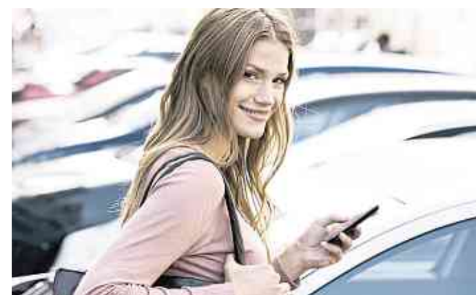
Der erste Job, das erste Auto – so macht der Start ins Berufsleben richtig Spaß.

Ist der Arbeitsvertrag unterschrieben, stehen bei den