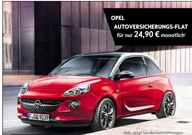
Abb. zeigt Sonderausstattungen.