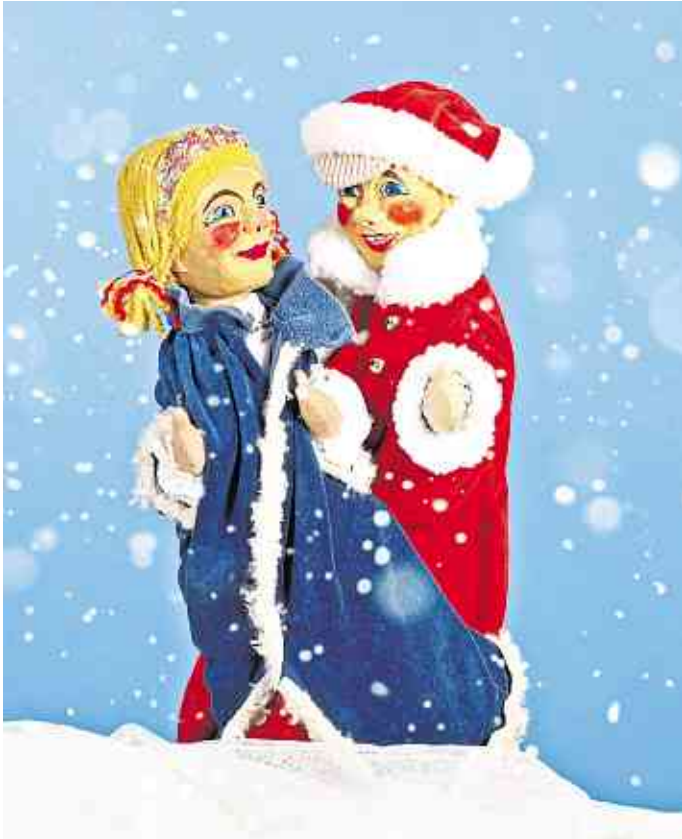
Weihnachtsmärchen mit Handpuppen.

Weihnachtsmärchen der Koblenzer Puppenspiele