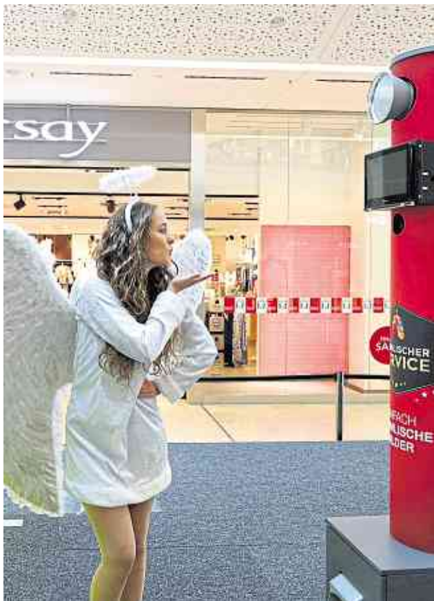
Himmlische Bilder mit der Center-Fotobox. Vielleicht die perfekte Idee für ein persönliches Weihnachtsgeschenk?

Nur ein Klick auf das Display – und innerhalb weniger Sekunden wird das Foto geschossen. Besucher erhalten das Bild direkt ausgedruckt und können es mitnehmen. Bei Gruppen können bis zu fünf Bilder gedruckt werden. Zusätzlich kann eine E-Mail-Funktion aktiviert werden, damit das Foto per E-Mail verschickt wird.