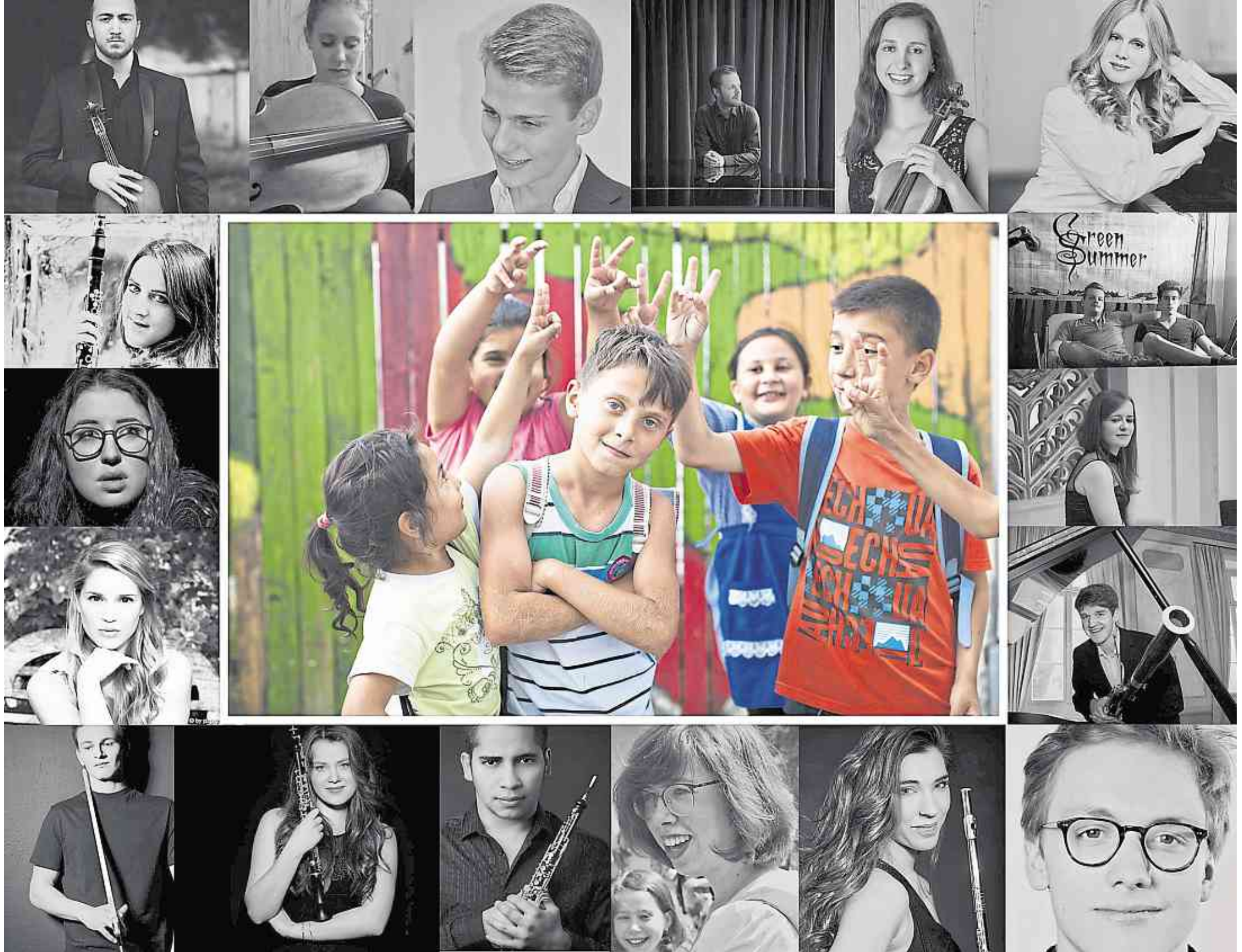
Musik vereint und kann wertvolle Hilfe leisten. Das beweist Musericordia e.V. mit seinem Benefizkonzert Gassenbauer Kulturtage.

■ Weitere Infos unter www.musericordia.com . Tickets für die Gassenbauer Kulturtage unter: www.ticket-regional.de/gk