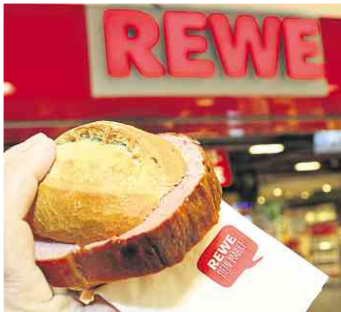
Im Monat Juli lockt ein Coupon über ein Fleischkäsebrötchen von REWE.