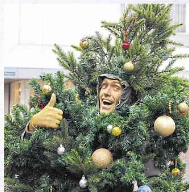
Der lebende Weihnachtsbaum sorgt für ausgelassene Weihnachtsstimmung.

Er ist grün, festlich geschmückt und steht bekanntermaßen als Symbol schlechthin für das Weihnachtsfest: Ohne Tannenbaum geht es nicht! Selbstverständlich sind festlich geschmückte Christbäume – farblich passend zu den unterschiedlichen Centerbereichen – fester Bestandteil der Center-Weihnachtsdekoration. Zum Late-Night-Shopping am 16. Dezember findet man hier zudem ein ganz besonderes Pflänzchen: den lebenden Weihnachtsbaum. Ab 18 Uhr ist dieser fröhliche Walking-Akt in der Ladenstraße unterwegs – und bringt unsere Besucher mit seiner charmanten Art und seiner Lebensfreude garantiert zum Lachen.