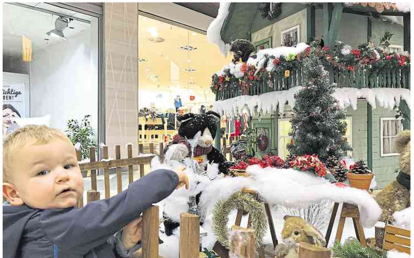
Die weihnachtlichen Steiff-Szenarien in der Ladenstraße laden zum Entdecken ein.