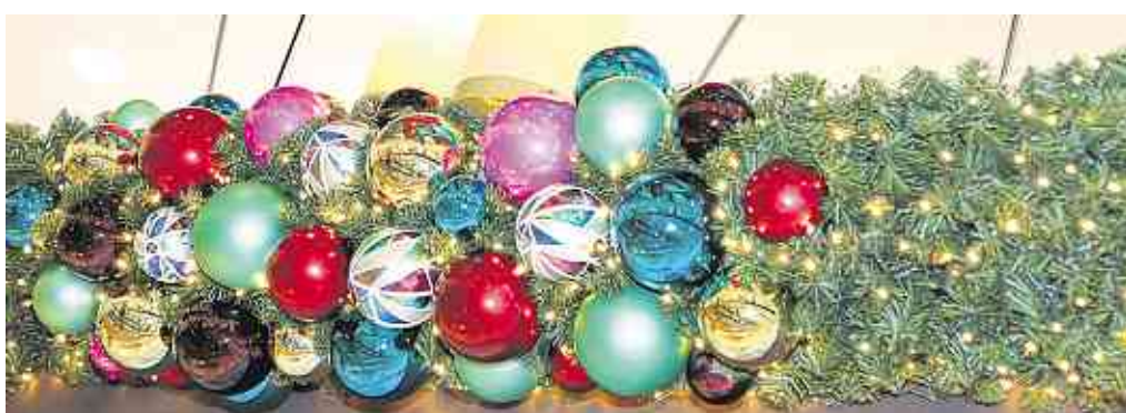
Neu sind u.a. die Lichtergirlanden mit bunten Glaskugeln, passend zum Farbkonzept.