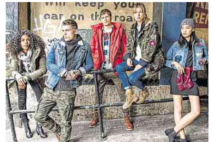
Superdry – das sind betont lässige Looks für einen entspannten Streetwear-Style.