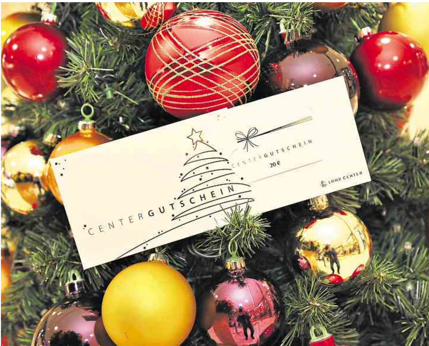
Oh du fröhliche: Schenken kann so einfach sein – mit dem Center-Geschenkgutschein. Erhältlich ist er an der Kundeninformation.