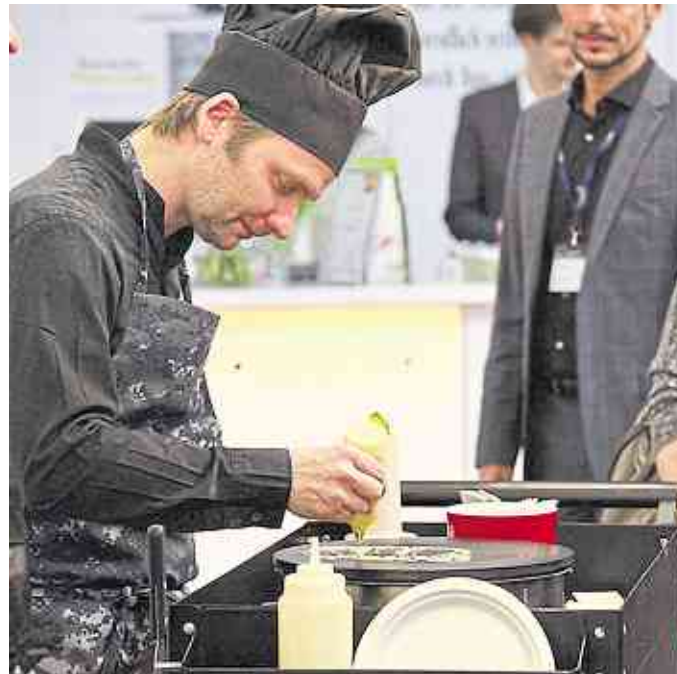
Die Pfannkuchen-Porträts sind fast zu schade, um sie zu vernaschen. Zur Erinnerung können natürlich Fotos gemacht werden.

Porträt-Zeichnung ein echter Hingucker. Vor dem Vernaschen gilt allerdings: Schnell noch ein Foto mit dem Smartphone schießen – so bleibt eine schöne Erinnerung für die Ewigkeit.