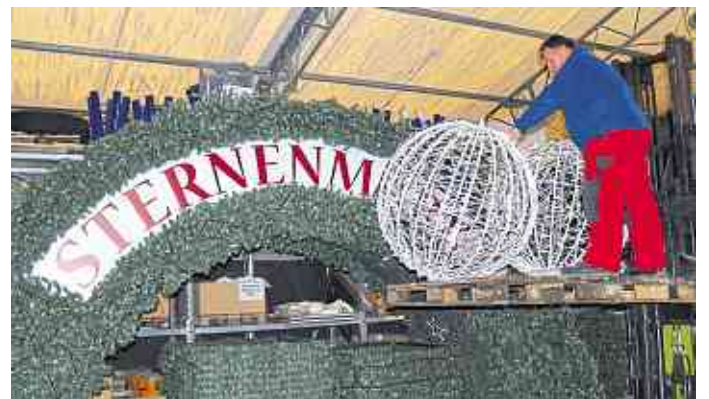
Unzählige Lichter werden an dem Eingangsbogen zum neuen Sternenmarkt funkeln, der in diesem Jahr zum ersten Mal den festlich geschmückten Koblenzer Weihnachtsmarkt bereichert.

re kreativen Werke am Baum verteilen. Alle geschmückten Weihnachtsbäume nehmen an einer Verlosung teil. Am Sonntag, 17. Dezember, werden um 17 Uhr auf dem Sternenmarkt die drei Hauptpreise in Form einer Geldspende der Sparkasse Koblenz ausgelost. Doch niemand geht mit leeren Händen nach Hause: Es wird einen zusätzlichen Preis für jeden Teilnehmer geben: „Das Gemeinschaftserlebnis steht im Mittelpunkt“, betont Detlef Koenitz.