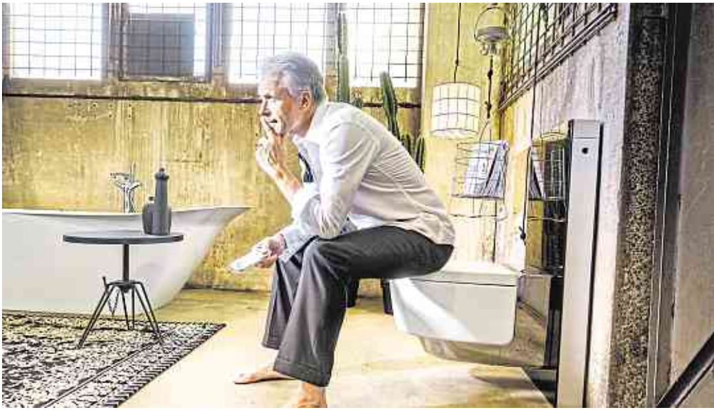
Männer verbringen mehr Zeit im Bad als gedacht - und lieben auch dort elektronische Gadgets, die Spaß machen und mehr Komfort bieten.