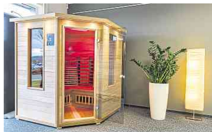
Die Eckkabine des Typs 160, Typ 180 und 115 versprühen wohltuende Wärme.

Egal zu welcher Jahreszeit: Wärme wirkt. Ob gestresste Gemüter, strapazierte Gelenke oder eine verspannte Muskulatur – Wärmeanwendungen haben naturgemäß viele vorteilhafte Wirkungen auf den menschlichen Körper. Sie entspannen, beruhigen, unterstützen den Stoffwechsel, verbessern die Durchblutung, stimulieren das Immunsystem und lindern sogar Schmerzen. Holz kann ungesund sein. Denn in Werkstoffen können sich Schadstoffe aus den Bin-