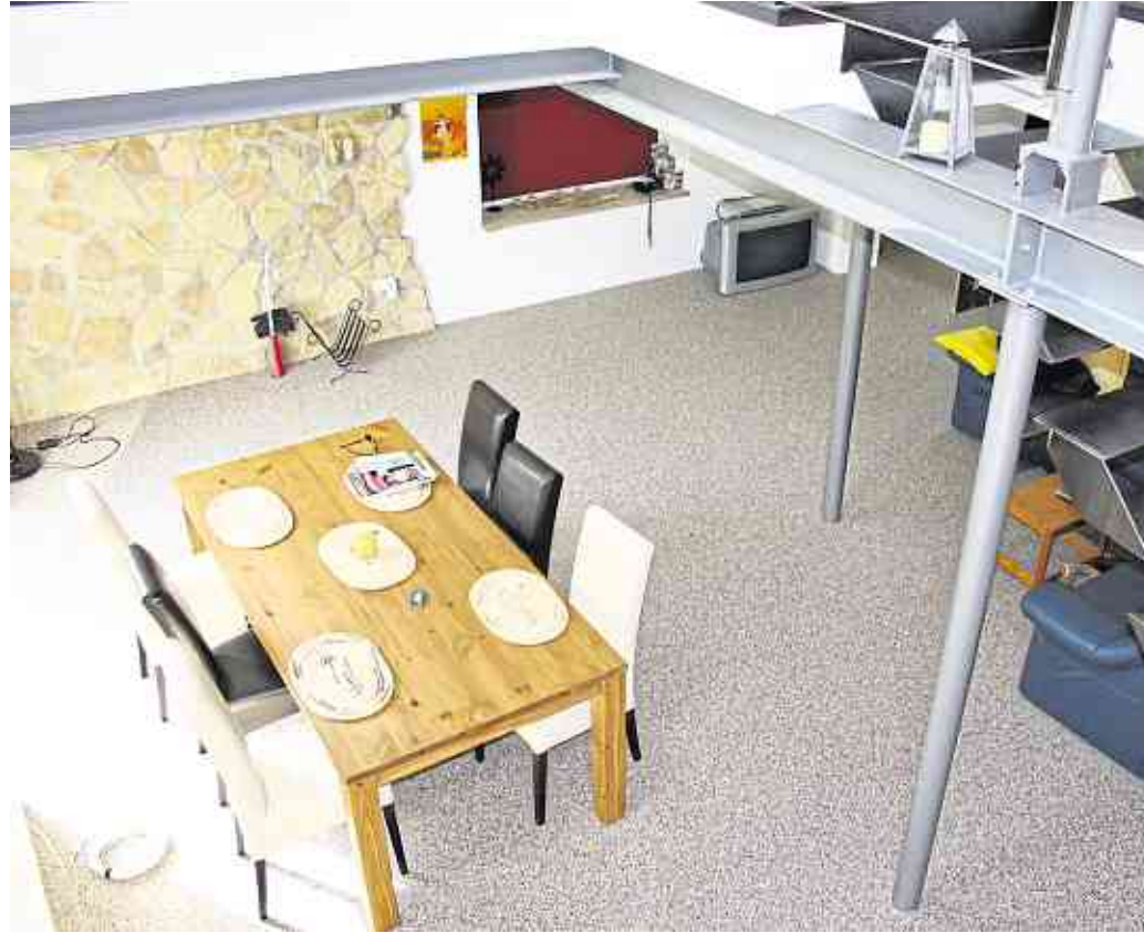
Natursteinteppiche verleihen dem Zuhause einen individuellen Look. Dabei ist das Material robust, einfach zu reinigen und lässt sich in nahezu allen Räumen verlegen.