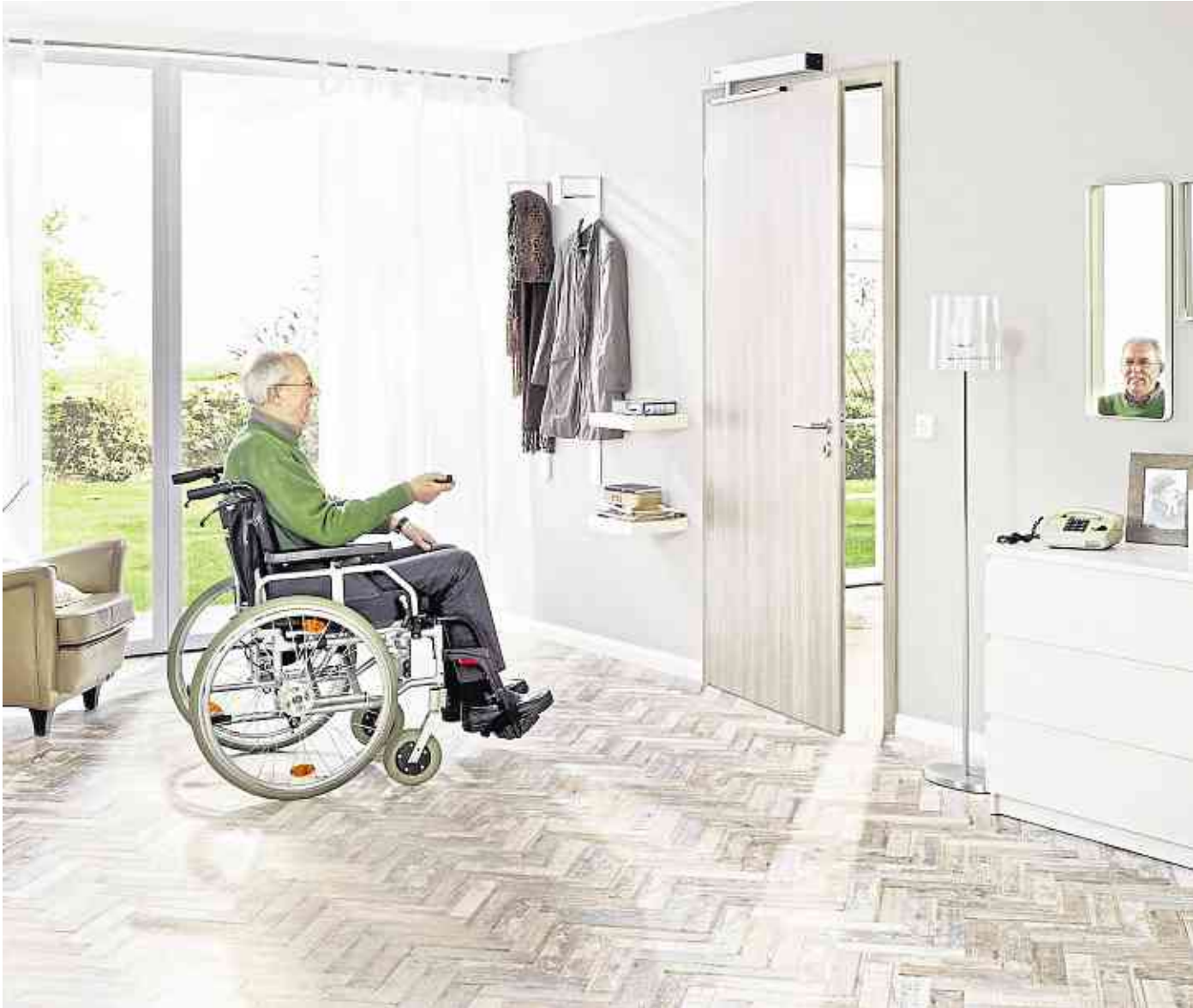
Türen, die sich selbsttätig öffnen und schließen, sind gerade für ältere Menschen eine Erleichterung im Alltag.