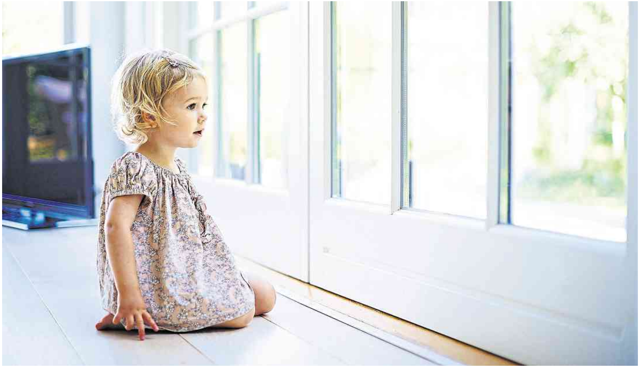
So fühlt man sich zu Hause wohl: Ein Dichtungsaustausch hält Kälte, Lärm und Feuchtigkeit draußen und hilft Energiekosten zu sparen.

Um Schwachstellen im wahrsten Sinne des Wortes zu schließen, sollte man auf Meterware zurückgreifen in Kombination mit vorgefertigten oder maßgeschneiderten Dichtungsecken. Oder