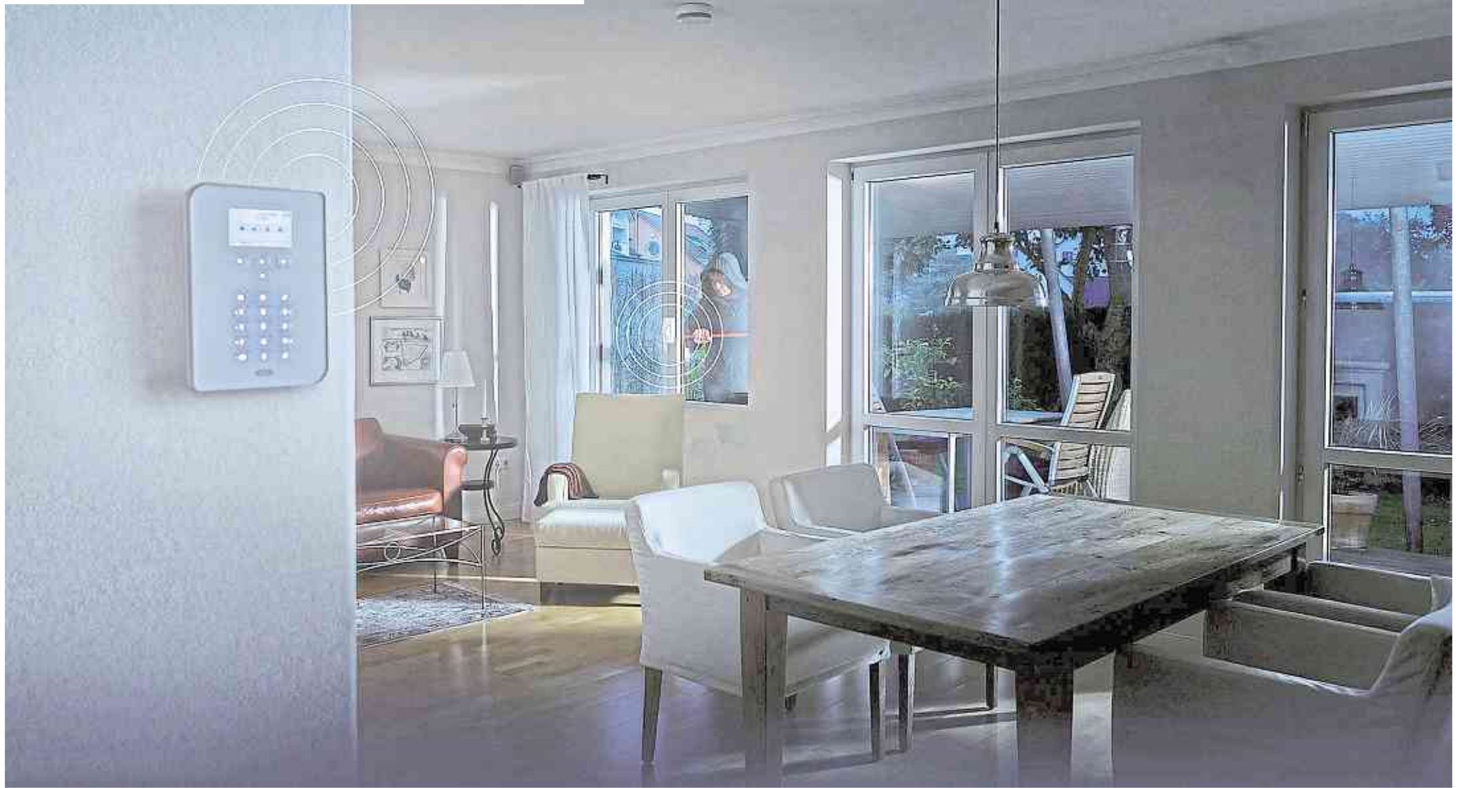
Professionell installierte Alarmanlagen bieten einen guten Schutz gegen Einbrecher.

Viele Privathäuser sind nicht genügend gegen Einbruch geschützt