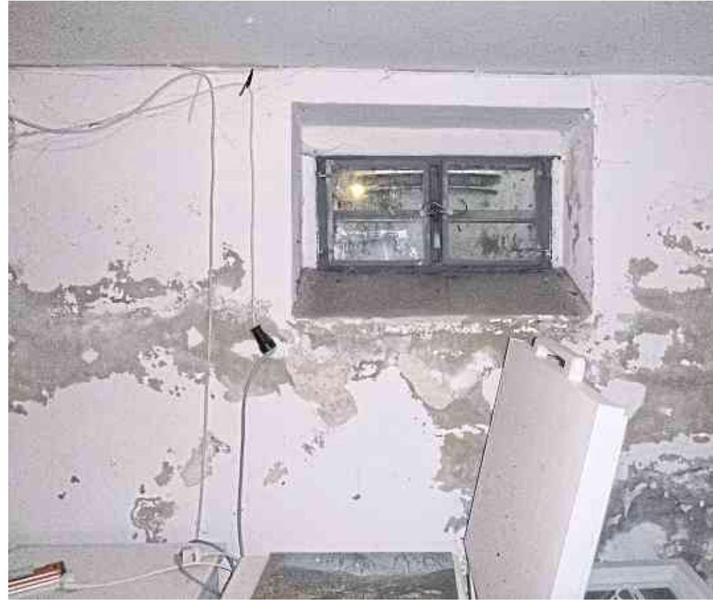
Vorher: Die Schäden an der Wand sind nicht zu übersehen.

korrodieren. War die erhöhte Feuchtigkeit bei Mietabschluss nicht bekannt, so kann dies zu Mietstreitigkeiten führen. Im vorliegenden Fall wurden die