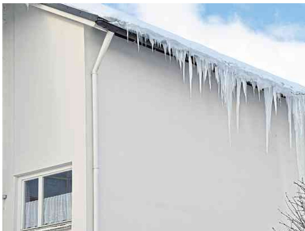
Hier wird es über Nacht zur Eiszapfenbildung kommen. Ursache ist ein fehlender Schneefang, so dass die gesamte Schneelast auf der Dachrinne liegt.