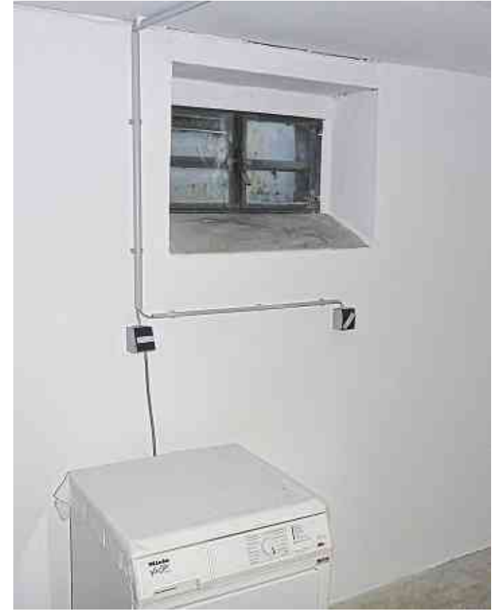
Nachher: Nun kann der Keller wieder genutzt werden.

Feuchte bei Mietabschluss nicht bekannt, so kann dies zu Mietstreitigkeiten führen. Im vorliegenden Fall wurden die erdberührten Außenwandflächen in den vergangenen Jahren bereits von außen nachträglich abgedichtet. Aufsteigende Feuchte und Restfeuchte im Mauerwerk mit damit verbundenen Aus-sal-zun-gen an den Innenoberflächen sorgten für sichtbare Schäden und sehr hohe Luftfeuchtigkeit in den Kellerräumen. Die Abstellräume im Keller waren nicht vermietbar.