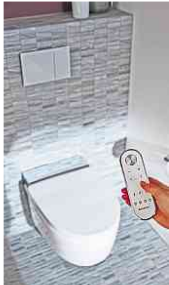
Weckt den Spieltrieb und bringt mehr Frische: Premium Dusch-WC mit einer Vielzahl von Komfortfunktionen.

gendlichen Geschäfte niedersetzt. Doch damit nicht genug: Auch das Öffnen und Schließen des WC-Deckels nimmt ihm ein Dusch-WC ab. Damit nichts die frische Morgenluft trübt, entfernt eine automatische Geruchsabsaugung schlechte Gerüche schon in der WC-Keramik – bevor sie sich im Bad aus-