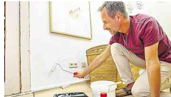
Schimmel versteckt sich oft hinter großflächigen Möbeln vor schlecht isolierten Außenwänden.

Wer renoviert, kann schon beim Tapezieren und Streichen etwas gegen Schimmel tun. Die Lösung kann beispielsweise ein pilzhemmendes Mittel sein. Es wird einfach in Wandfarbe, Tapetenkleister oder andere wasser- verdünnbare Renovierungsmaterialien eingebracht und