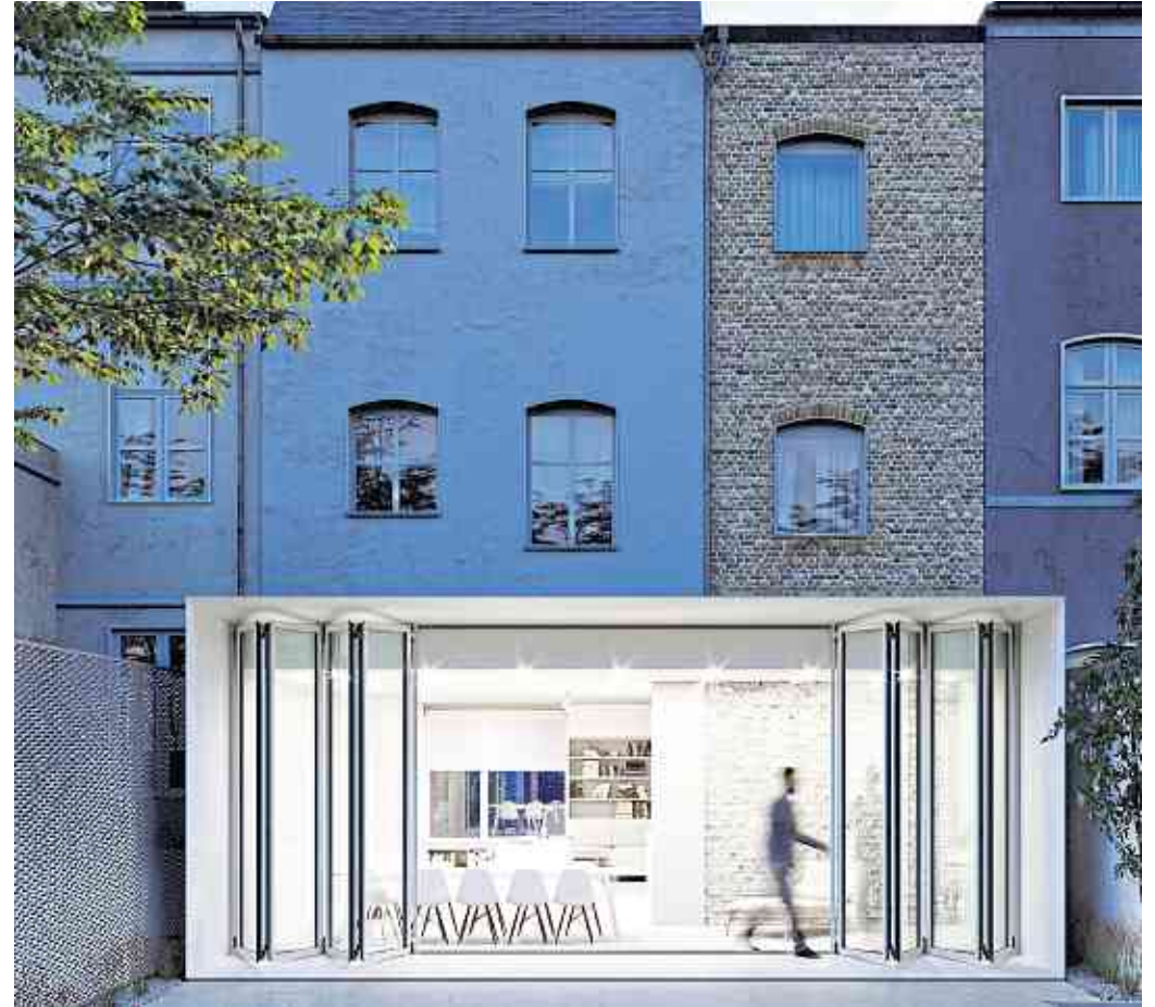
Eine Glas-Faltwand erhöht die Tageslichtausbeute, lässt den Wohnraum großzügiger wirken und eröffnet den ungehinderten Blick in den Garten. Auf Wunsch lässt sich die Faltwand zudem über die gesamte Breite zur Seite falten.

sich die Bewohner zum Beispiel abends im Schlafzimmer nur durch einen Tastendruck auf ihrem Funkhandsender vergewissern, ob das Garagentor auch wirklich geschlossen ist. Und falls nicht, genügt ein weiterer Tastendruck, um das Tor zu schließen. Gleiches funktioniert auch mit der „BiSecur“-App über Smartphone oder Tablet von allen Orten der Welt. djd