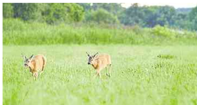
Mitten im Sommer beginnt die Paarungszeit der Rehe. Vor allem in diesen Wochen steigt die Gefahr für Wildunfälle