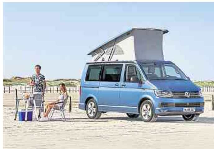
Mit dem Camper kann man im Urlaub an schönen Orten spontan übernachten. Doch ist hier die Gefahr von Überfällen größer als auf einem Campingplatz.

● Camper: Besser auf Camping- oder Stellplätzen übernachten. Auf Park- oder Rastplätzen sind nächtliche Überfälle keine Seltenheit. (SP-X)