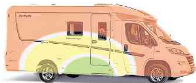
Schweres muss immer ganz nach unten

Eine falsche Gewichtsverteilung kann das komplette Gespann in Gefahr bringen. Auch, wenn große Bett- oder Deichsel-Kästen viel Stauraum bieten, sollten dort nur leichte Dinge untergebracht werden. Darüber hinaus empfiehlt es sich, so viel Gepäck wie möglich im Zugfahrzeug unterzubringen. Allerdings sollte auch hier die Zuladungsgrenze beachtet werden. Aber: Je schwerer das Zugfahrzeug und je leichter der Anhänger, desto sicherer fährt das Gespann. Sind Caravan oder Reisemobil fertig beladen, sollte vor Abfahrt sichergestellt werden, dass alle Ablagen freigeräumt und alle Türen und Schubladen abgeschlossen. Zudem sollte ein letzter Blick der Ladung in den Staufächern und deren Sicherung gegen Verrutschen gelten. (SP-X)