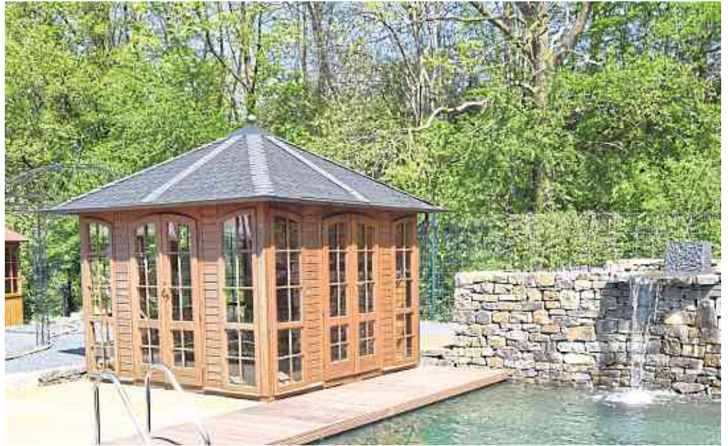
Wasser, Licht, Steine und Pflanzen ergeben ein harmonisches Gesamtbild.

56727 Mayen • Koblenzer Str. 175 • Tel. 0 26 51 / 70 17 00