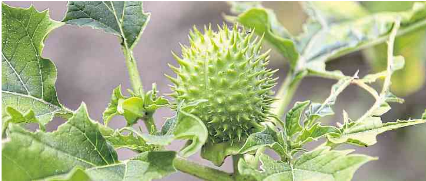
Der Stechapfel. Toll anzusehen, aber sehr gefährlich.