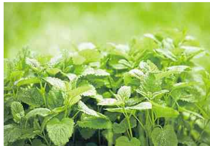
Duftet himmlisch erfrischend und hilft bei Frauenleiden: Melisse