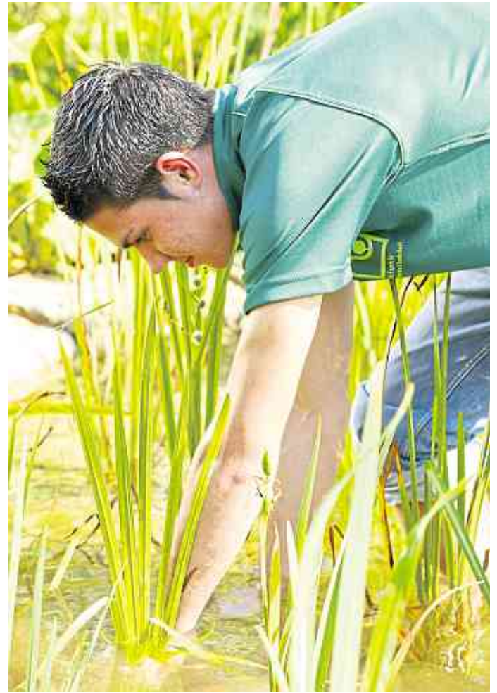
Mit der Bepflanzung wird der Teich komplett

Ein gestaffelter Aufbau der Ufer- und Teichrandpflanzen ist sinnvoll, damit der Gartenbesitzer einen freien Blick auf die offene Wasserfläche behält. In den Vordergrund werden die niedrigeren Feuchtgebietspflanzen gesetzt, an die Seiten die größer werdenden Gewächse und den Hintergrund bilden die Sträucher und Bäume. Daran schließen dann die reinen Landpflanzen an, die jenseits des Teichrandes stehen und den Übergang zur Vegetation des übrigen Gartens bilden. Wichtig bei der Gartengestaltung ist auch, dass die Proportionen zwischen Wuchshöhe der Pflanzen und der Teichgröße stimmen. Gerade bei kleinen Gewässern empfehlen Landschaftsgärtner daher: Weniger ist mehr! dgl