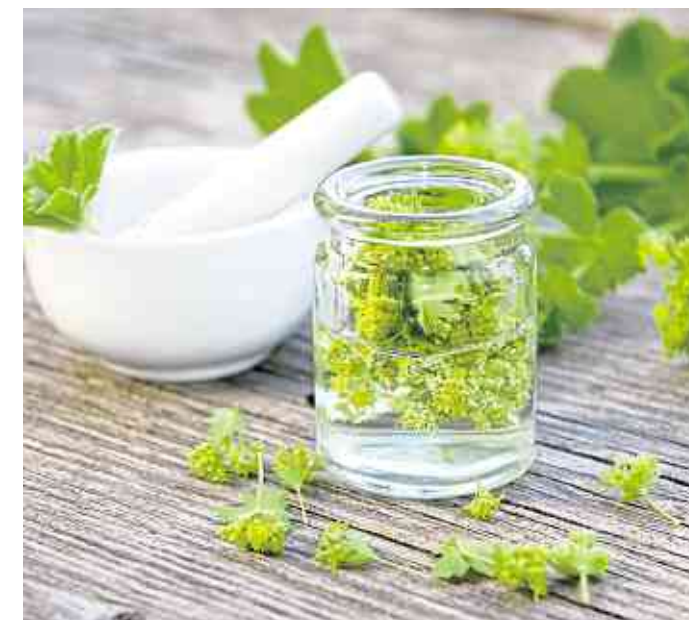
Der Name verrät schon alles: Frauenmantel tut Frauen gut.