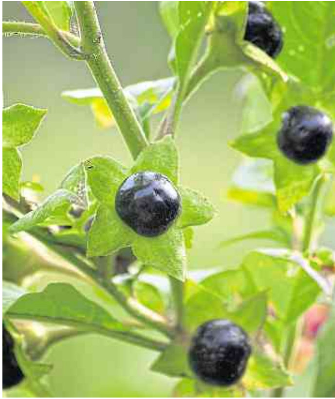
Die Schwarze Tollkirsche ist eine giftige Pflanze mit meist schwarzen, kirschfruchtähnlichen Beerenfrüchten.