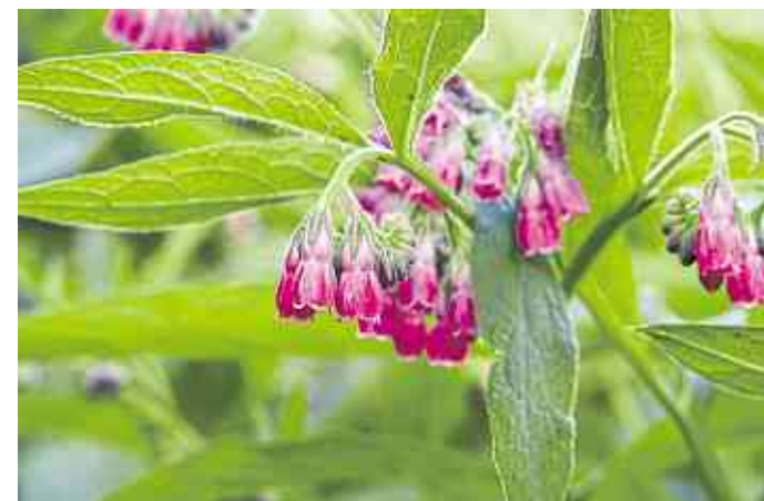
Beinwell ist schon seit über 2000 Jahren als Heilpflanze bekannt.

jahr oder im späten Herbst. So verhindert man auch die unkontrollierte Ausbreitung der Pflanze. Beinwell mag feuchte Erde und streckt dort im Frühjahr als einer der Ersten seine Triebe aus dem Boden. Mit Stücken der Wurzel