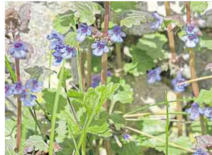
Der Name Gundermann rührt von der Heilkraft dieses Krautes bei Eiter.

ser Körper mit diesen sogenannten „Bagatellverletzungen“ konfrontiert und hat zu diesem Zweck eine ganze Palette an Strategien, um damit fertig zu werden. Gegen Unterstützung ist jedoch nie etwas einzuwenden, weshalb wir in unserem Kräuterrad bewährte Heilkräuter vorstellen, die bei der Behandlung von Verletzungen sehr hilfreich sind.