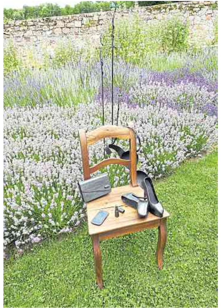
Während der Lavendelfeste im Kräutergarten gibt es u.a. Stände mit Kunsthandwerk, Kräuterspezereien und natürlich Lavendelprodukten.

Entstanden ist ein Haus mit Weitblick, das auch in der Toskana stehen könnte, mit einem Dörrturm, in dem die Zitronenverbene trocknen, die neben dem Lavendel zu den wichtigsten Pflanzen des Kräutergartens gehören. Zur Anlage des Kräutergartens Klostermühle gehört ein naturnah gestalteter Teich, ein Steingarten, herrliche Mauern mit Glyzinien und Clematis, Rosen, die verschiedensten Heilkräuter wie Salbei, Thymian, Rosmarin, ... und unübersehbar viel Lavendel und Zitronenverbene, die beide hier an Ort und Stelle auch zu Tee oder zu Sirup und Lavendelwasser