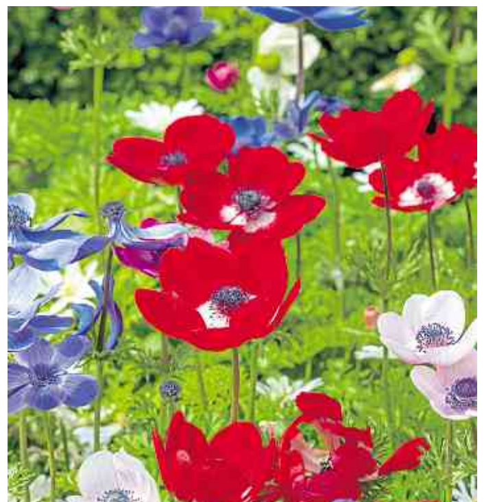
Steht im Schnittblumenbeet gern im Vordergrund: die „De Caen“-Mischung mit roten und blauen Gartenanemonen.

monen (Anemone coronaria) eher niedrig. Die freundlichen Blüten machen sich daher an den Rändern der Beete sehr gut. Eine Mischung aus „De Caen“-Hybriden leuchtet in magischem Blau und feurigem Rot. Ihre Blütenform erinnert entfernt an Mohnblumen und sie machen ein schönes Sommersträußchen für die Kuchentafel auf Balkon, Veranda oder Terrasse. Weitere Informationen sowie Blumenzwiebeln und Knollen sind unter www.fluwel.de zu finden. GPP