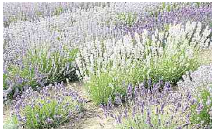
30 verschiedene Lavendelsorten gibt es hier zu beschnuppern und bewundern - längst nicht alle blühen blau!

► Das vollständige Veranstaltungsprogramm steht aktuell auf www.kraeutergarten-klostermuehle.de