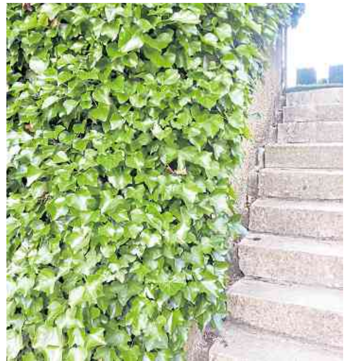
Mauern im Garten lassen sich mit Efeu einfach und dauerhaft begrünen.

Auch Zäune aus Maschendraht oder Holz lassen sich durch Efeu in einen grünen Sichtschutz verwandeln und geben nach einiger Zeit den Anschein einer Hecke. Da der Efeu ein Wurzelkletterer ist und keine Schlingpflanze, muss man ihm an einem Maschendrahtzaun etwas Nachhilfe geben, indem man die Triebe anfangs durch die Maschen schlingt. An einem geschlossenen Holzzaun hangelt er sich jedoch als Selbstklimmer mit seinen Haftwurzeln von alleine empor. Für eine Zaunberankung emp-