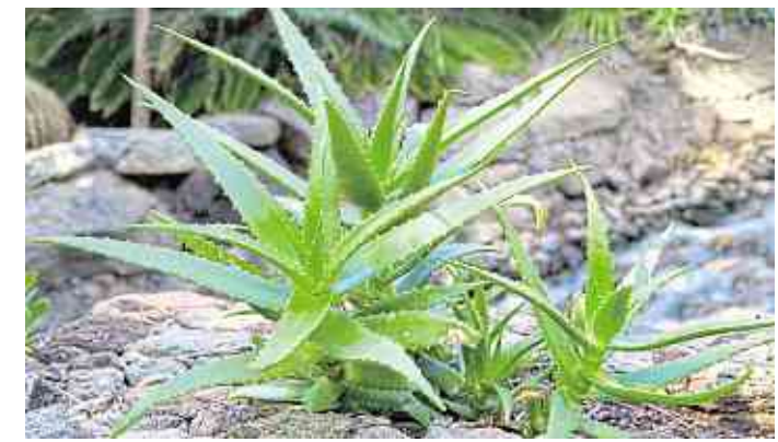
Die Heilpflanze Aloe vera ist für die Behandlung von Hauterkrankungen bekannt.

Seit mehr als 5000 Jahren ist die Heilkraft der Aloe Vera in der arabischen Medizin bereits bekannt, zu uns kam die Kenntnis von ihrer wohltuenden Wirkung erst am Anfang des 20. Jahrhunderts. In den letzten Jahren hat die Pflanze, die aussieht wie eine Kaktee, in Wirklichkeit aber eine Liliaceae ist, ihren Siegeszug durch die Kosmetikindustrie angetreten. Sie wird verschmiert, getrunken, gesprayed und gegessen, kaum eine Anwendungsart, für die Aloe Vera nicht geeignet scheint. Dabei muss man darauf achten, welcher Teil der Pflanze zum Einsatz kommt. Durch ihren hohen Feuchtigkeitsgehalt ist das Gel, welches austritt, wenn man die fleischigen Blätter anschneidet, ein gutes Mittel gegen Verbrennungen und andere Hautirritationen. Um das hei-