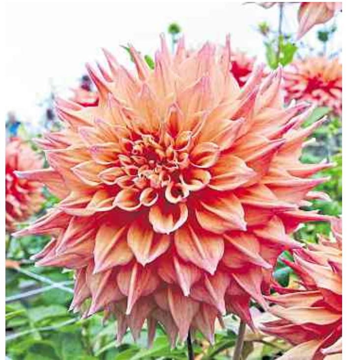
Ein Highlight für Gärten und Sträuße: Die Dahlie ‚Hart’s Dr. McMurray‘ blüht eindrucksvoll in einem sommerlichen Apricot.

Zantedeschia kennen die meisten eher unter ihrem umgangssprachlichen Namen „Calla“. Auch sie ist ein Klassiker in Blumengestecken und Sträußen. Ihre kelchartig aufgerollten Hochblätter umschließen einen Kolben, auf dem unzählige, kleine Blüten sitzen. Knollen-Zantedeschia werden im Frühling gepflanzt und erweitern das Schnittblumenbeet um eine elegante Persönlichkeit. Auch sie