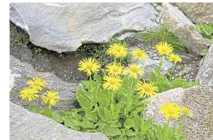
Arnica ist das beste homöopathische Mittel bei Verletzungen und Gewebsschäden aller Art.

Seit vielen Jahrhunderten ist sie als Heilpflanze bekannt, aber es sollte nur der sie ein-