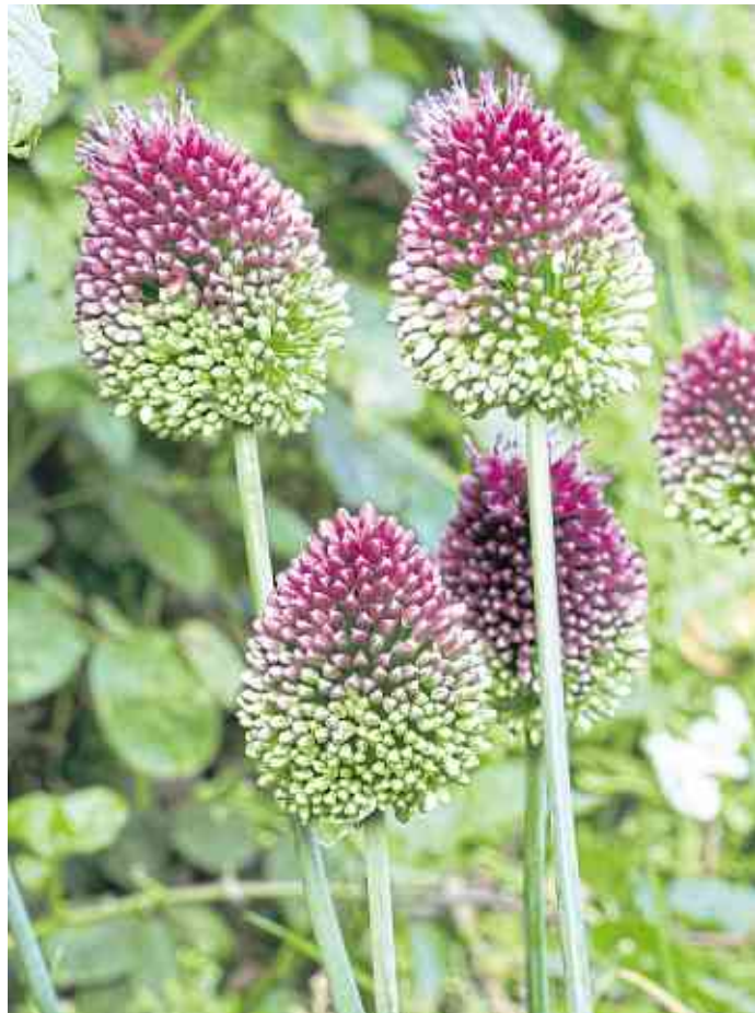
Drumsticks blühen im Frühjahr, wenn die meisten mehrjährigen Pflanzen schon große Blätter, aber noch keine Blüten haben.

Perfekte Bienenweide im Frühjahr: Allium 'Globemaster'. Gepflanzt werden die Zwiebelblumen im Herbst.